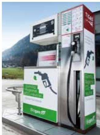
Biogas-Tankstelle an der B169 in Schlitters im Zillertal. Tanken von CO 2 -neutralem, feinstaubfreiem und preisgünstigem Biogas aus heimischer Produktion.

Wir machen aus Ihren Speiseresten Biogas! Unser biogasbetriebenes Sammelfahrzeug bringt Ihre Speisereste CO 2 -neutral zur Erzeugungsanlage der Bioenergie Schlitters. Aus den Speiseresten wird Biogas gewonnen, anschließend werden diese zu Bio-Erdgas aufbereitet und in das Erdgasnetz der TIGAS eingespeist.